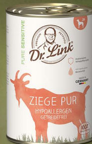
Ziege pur, hypoallergen

* Tierische Proteine bestehend aus Fleisch und tierischen Nebenerzeugnissen