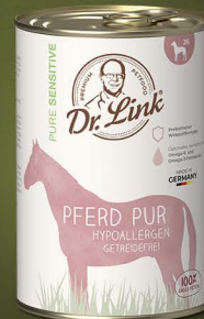
Pferd pur, hypoallergen