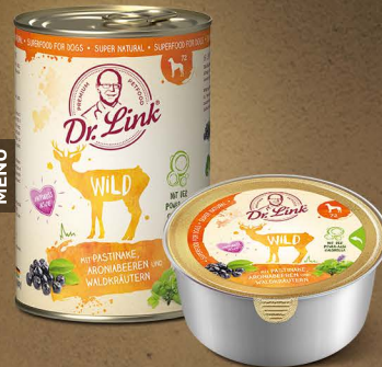
Wild mit Pastinake, Aroniabeeren und Waldkräutern