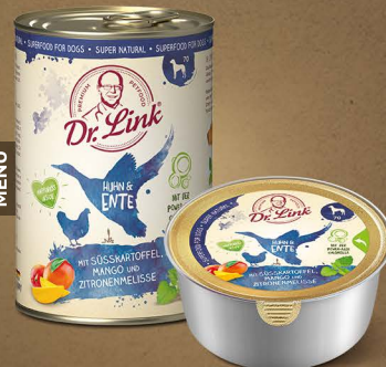
Huhn & Ente mit Süßkartoffel, Mango und Zitronenmelisse