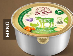
Truthahn & Kalb mit Pastinake, Sanddornbeeren und Löwenzahn