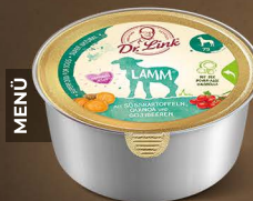
Lamm mit Süßkartoffeln, Quinoa und Gojibeeren